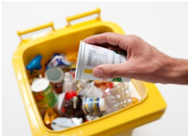
Gelbe Tonne mit Verkaufsverpackungen

Der Begriff „Verpackung“ tauchte im deutschsprachigen Raum erstmals Mitte des 19. Jahrhunderts als Sammelbegriff für Verpackungsmittel auf. Er hat seinen Ursprung in dem Wort „Pack“, von dem sich auch „packen“ und entsprechende Abwandlungen wie „Gepäck“ oder „Päckchen“ herleiten. „Pack“ stammt aus dem Mittelniederdeutschen, das es seinerseits aus dem Mittelniederländischen entlehnt hat – und zwar vom Wort „pac“. So wurden im 12. Jahrhundert im flandrischen Wollhandel Bündel und Ballen bezeichnet; gleichzeitig diente es als Zählmaß. Durch den blühenden Handel wurde der Begriff auch in andere Sprachen übernommen – und so findet sich der Wortstamm bis heute im englischen „Pack“, im französischen „Paquet“ oder im italienischen „pacco“ wieder. aw